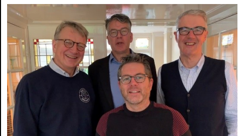
Bestuursleden in 2019 van de Stichting Participatie met Dementie.