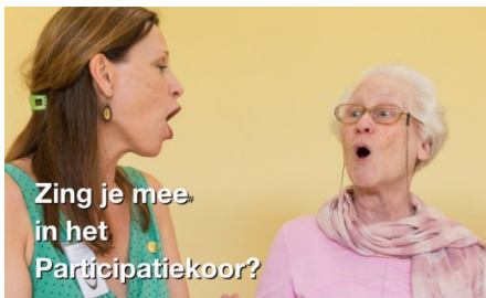
Zing je mee in het Participatiekoor?

Met veel inzet, creativiteit en betrokkenheid timmert de Stichting goed aan de weg.