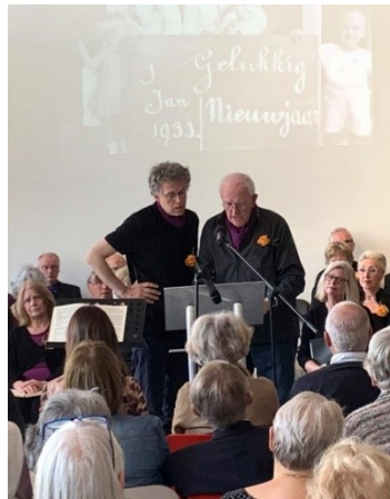
Een levensverhaal tijdens Het Participatiekoor Bergen.

De (mantel)zangers van 2019 willen vooral meer jongeren bij de Participatiekoren betrekken en nog meer zangers met dementie.