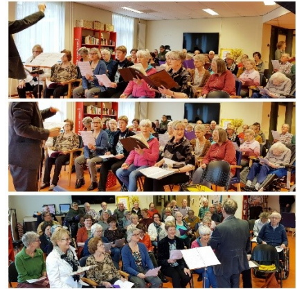
Een repetitie van Het Participatiekoor Leiden bij Topaz.